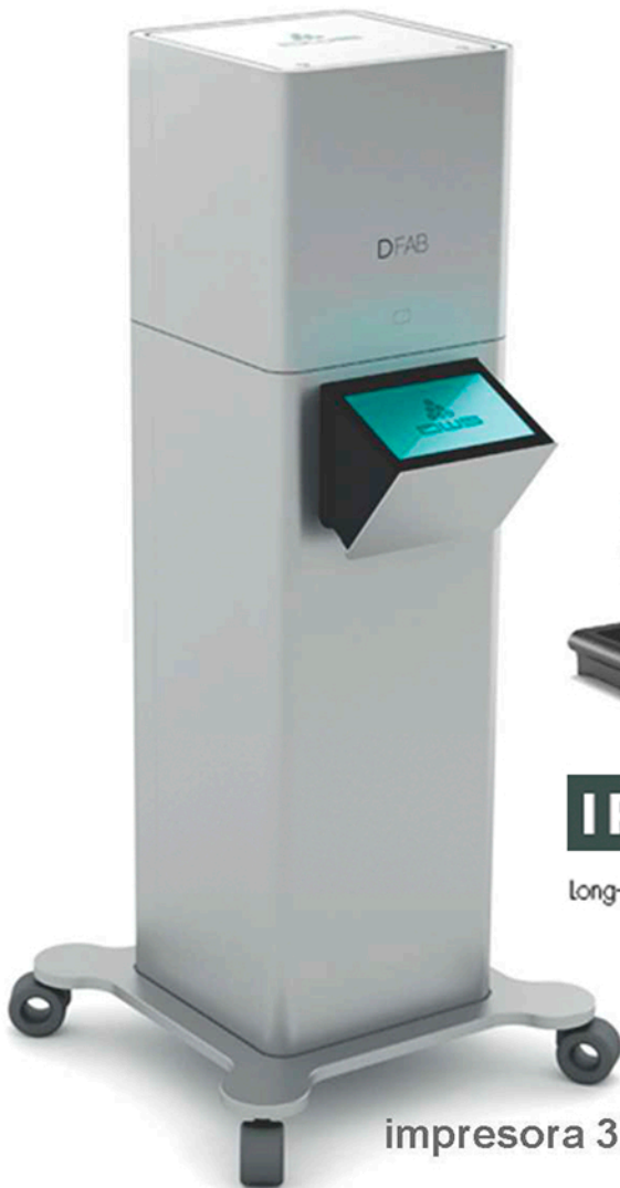
impresora 3D DFAB

AMORTICE SU INVERSIÓN, CON 30 CORONAS AL AÑO.